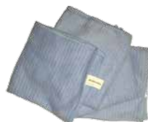
Lavette bleue microfibre