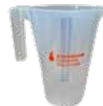
Pichet doseur 3L STOCKMEIER France