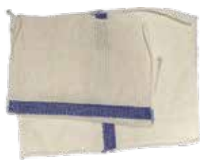
Lavette blanche coton lisse