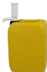
Pompe 100 ml pour JP 20 et 30L