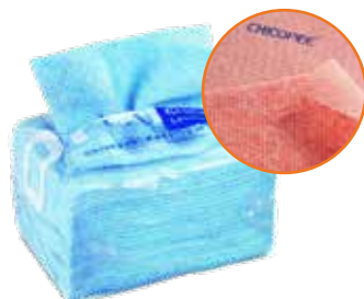
Lavette chicopée bleue

37x30 cm. 330 g/m 2 . Carton 200 (8X25).