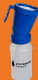
Gobelet BLEU TWIN DIPPER PLUS