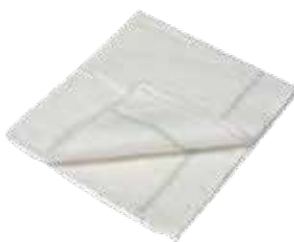
Lavette blanche non tissée.