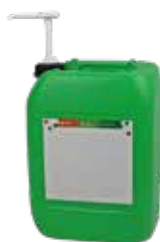
Pompe 30 cc diam. 61