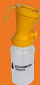
Gobelet FOAM JAUNE