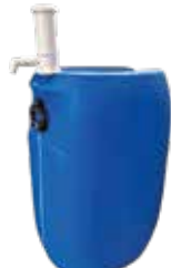
Pompe 100 ml pour TP 60L