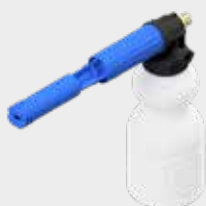
Bol mousser HP 2L pour nettoyeur HP