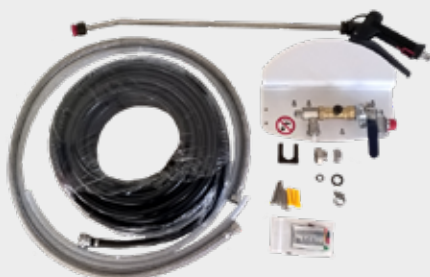
Centrale de désinfection