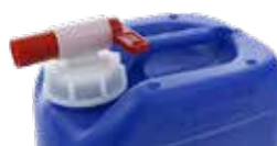
Robinet JP de 20 et 30L DIN61